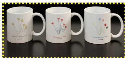
Il fronte delle tazze CABSS

viene data al piccolo la possibilità di muoversi, scoprire, orientarsi nello spazio seguendo una nuova consapevolezza del proprio corpo attraverso il suo stesso movimento. Oltre a ciò, la piscina di palline aiuta il bambino nei momenti di stress.