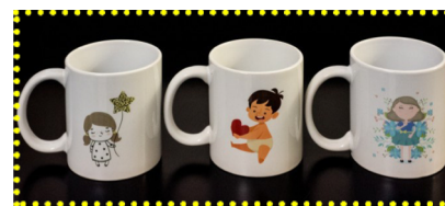
Il retro delle tazze CABSS

Per sostenere la nostra campagna potete scegliere fra tre diverse tipologie di tazze con disegni e bellissime frasi: “I Bambini sono Fiori che Sbocciano”, “I Bambini sono Amore Puro” e “I Bambini sono Stelle che