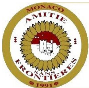
Logo di Amitié Sans Frontières