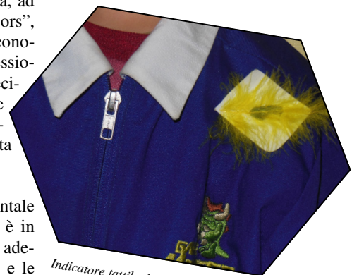
Indicatore tattile di un compagno di scuola di un bambino sordocieco

Considerando che, in Italia, la sordocecità è stata riconosciuta come disabilità unica solo nel maggio del 2010, ci auguriamo che al più presto venga prevista nella scuola una figura come quella sopra descritta. Inoltre, auspichiamo che possano essere investiti fondi per formare, e successivamente assumere, questi professionisti specializzati per lavorare con i bambini sordociechi.