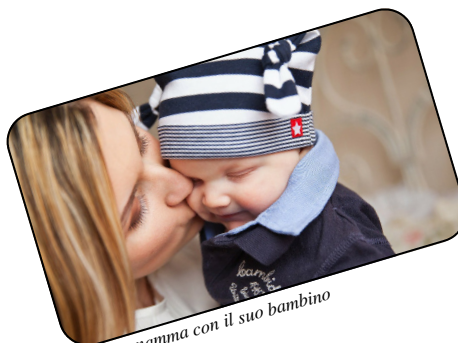
Una mamma con il suo bambino

Tutti i bambini hanno bisogno di interazioni armoniche con chi si prende cura di loro. Alcune ricerche riportano dati secondo i quali, se i genitori attuano cambiamenti positivi nei loro atteggiamenti e comportamenti, i bambini sordociechi a loro volta interagiscono più positivamente. A CABSS i genitori che frequentano assiduamente i programmi di intervento precoce, cambiano la prospettiva sul proprio figlio, sviluppando nuove capacità genitoriali e sono in grado di battersi per i diritti del proprio bambino. Inoltre, i genitori imparano specifici metodi di comunicazione e strategie che gli permettono di incrementare le loro competenze comunicative, di comprendere e rispondere ai bisogni dei propri figli.