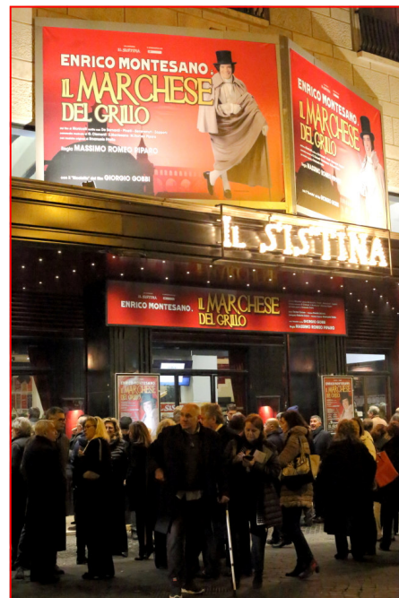
L'esterno del Teatro Sistina

“Il Marchese del Grillo - dichiara il regista - illumina Roma in un momento molto particolare della propria storia contemporanea. La schietta filosofia di vita di Onofrio del Grillo pervade l'intera Commedia di rimandi attualissimi e tremendamente affini con la realtà a cui tutti i romani devono quotidianamente fare fronte”.