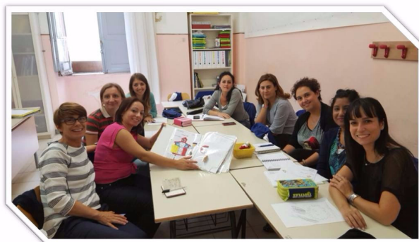
Consulenza dello staff CABSS in una scuola